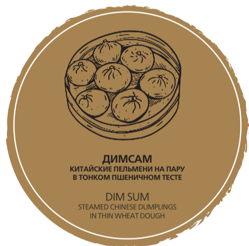
ДИМСАМ КИТАЙСКИЕ ПЕЛЬМЕНИ НА ПАРУ В ТОНКОМ ПШЕНИЧНОМ ТЕСТЕ

DIM SUM STEAMED CHINESE DUMPLINGS IN THIN WHEAT DOUGH